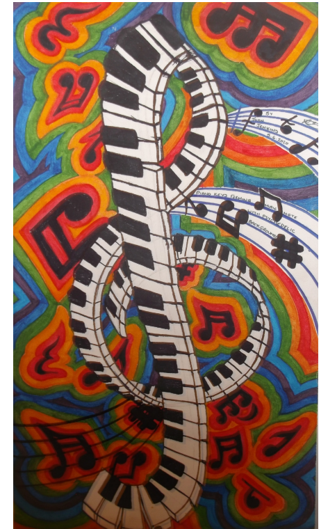
piano keys for musical note J. Jenkins

Στο Ωδείο # Ρυθμοί, Λ. Πεντέλης 14, Βριλήσσια, 21-6957901.