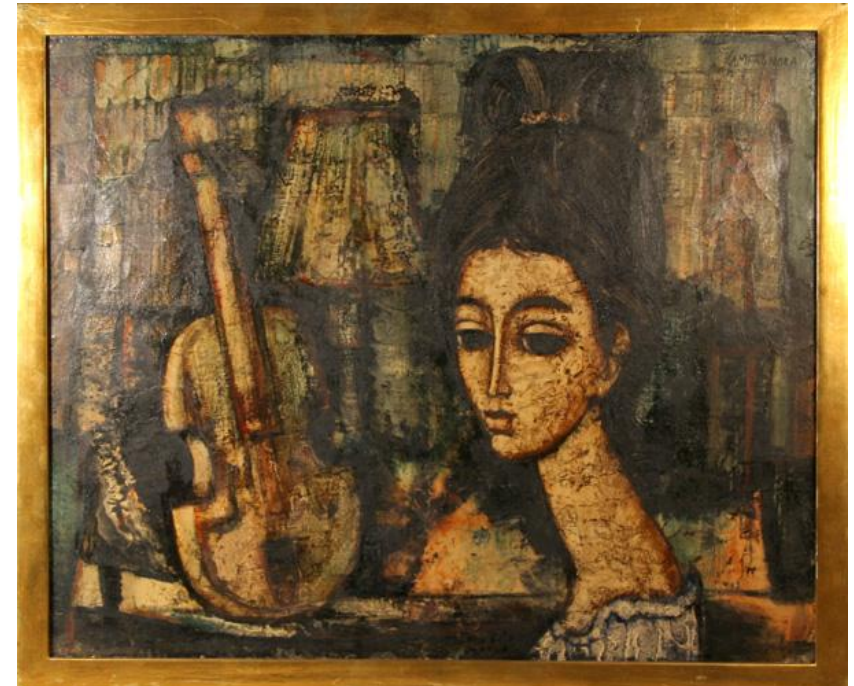
Enrico Campagnola, Γυναίκα με κιθάρα.

Στο σεμινάριο γίνονται δεκτοί ενεργοί σπουδαστές και ακροατές. Κάθε ενεργός σπουδαστής θα κάνει ένα ωριαίο μάθημα.